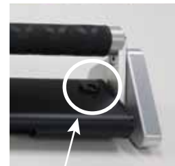
バッテリー駆動に切替可能な DCジャック付き