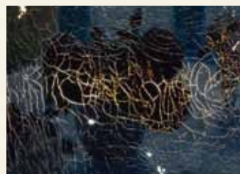
※透過光画像(裏面照射)