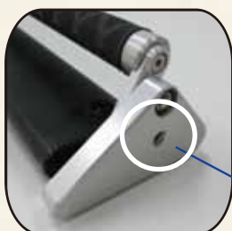
三脚取付け ビス穴