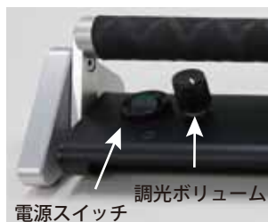
電源スイッチ 調光ボリューム