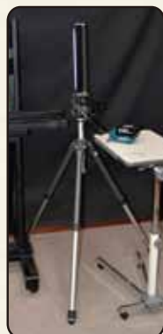
写真① 三脚取付け使用例